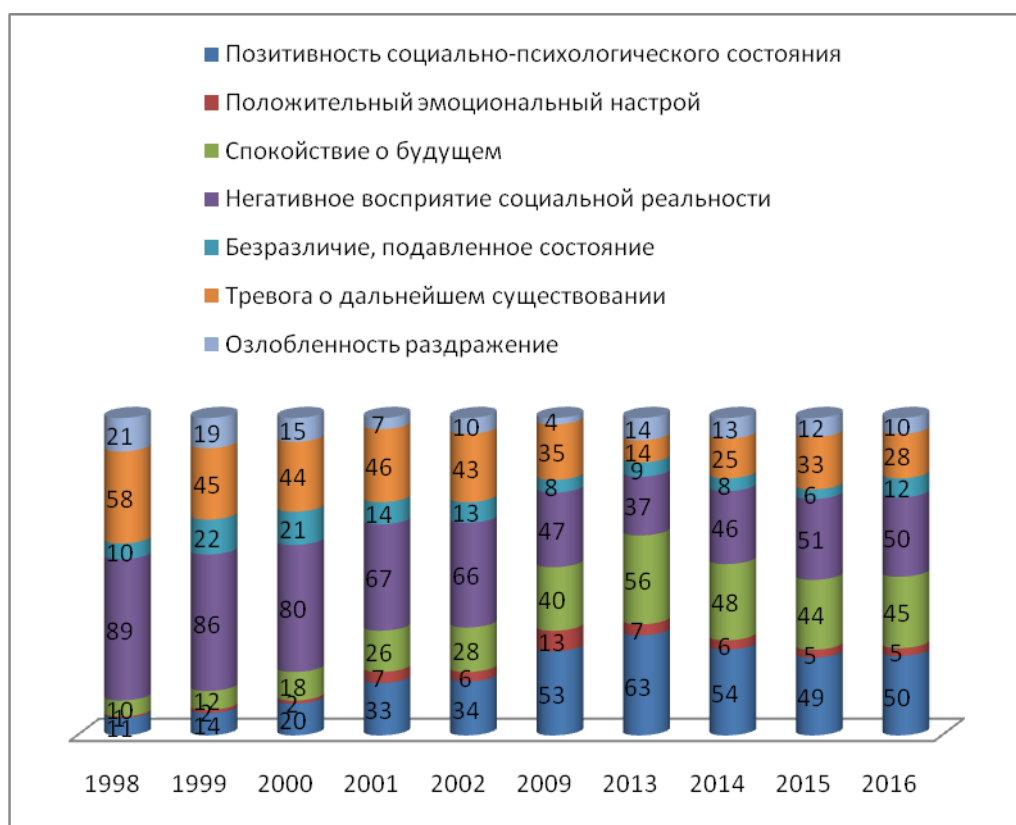
Рисунок 2. Оценка «социального комфорта» по данным экспертных опросов ВЦИОМ (Составлено автором)

Приведенный анализ отражает особенности «социального комфорта» во временном измерении. Подобным образом, может быть построен анализ и в территориальном разрезе. Уровень социального комфорта может быть сложен из различных приоритетов: удовлетворенность образованием, транспортной инфраструктурой, медицинским обеспечением и т.д. При любом раскладе показатели красноречиво отражают общественное суждение и позволяют оценить уровень достижения социальных ожиданий.